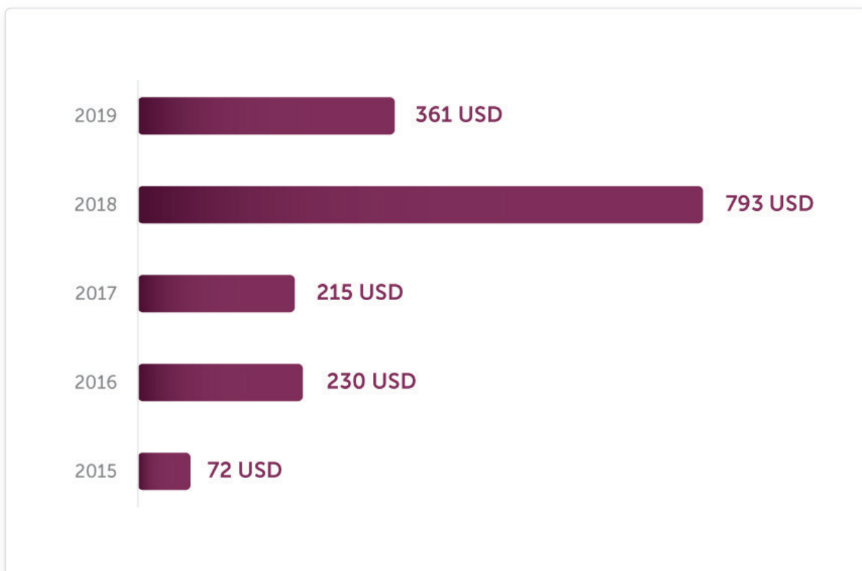
Grafikon 1 – Kineske SDI u Srbiji u periodu od 2015. do 2019. godine (u milionima USD, uključujući i investicije iz Hong Konga i Tajvana)